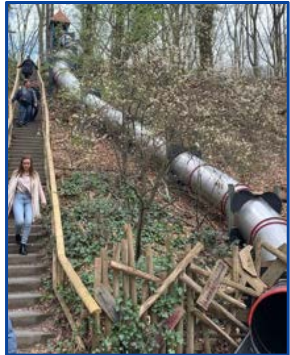
Klein Zwitserland Tegelen