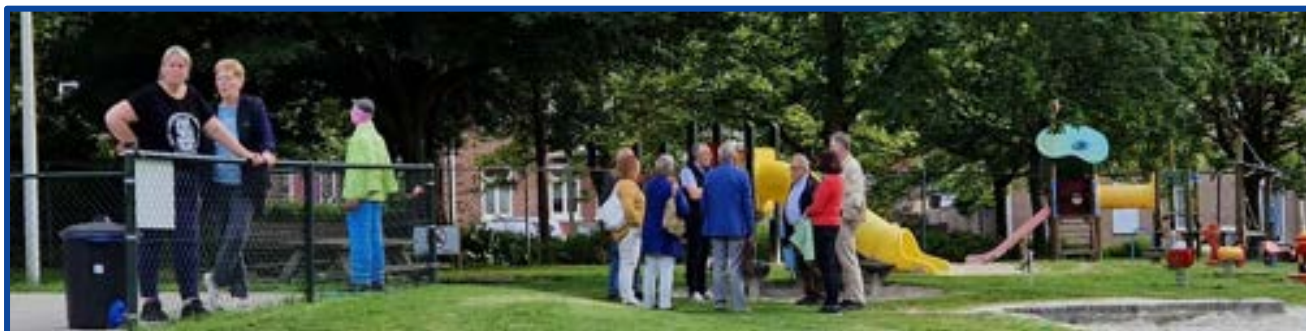
Algemene Ledenvergadering Kerkrade

Stichting het Gehandicapte Kind-Samenspeelfonds – contactpersonen diverse fondsen zowel lokaal als landelijk.