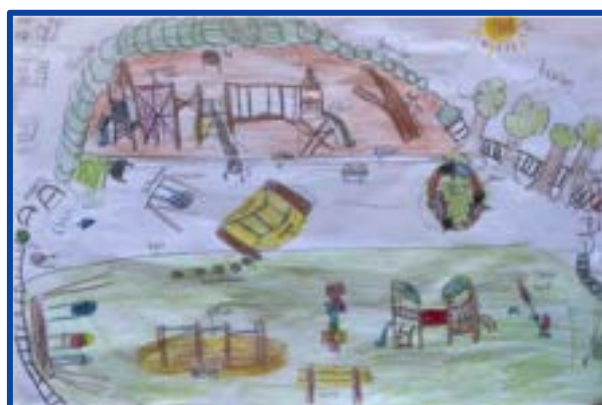
Ideeën voor nieuwe speeltuin 2025 in Beek-Genhout

Consulenten SpeL blijven ook in 2025 op de hoogte van de laatste lokale en landelijke ontwikkelingen op buitenspeelgebied middels webinars, vakliteratuur, en via (online) netwerkbijeenkomsten. Tevens jaarlijks een cursus/ training voor de consulenten.