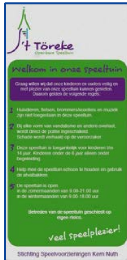
Spelregelbord 't Töreke Nuth

Jantje Beton – Provincie Limburg – Limburgse gemeenten