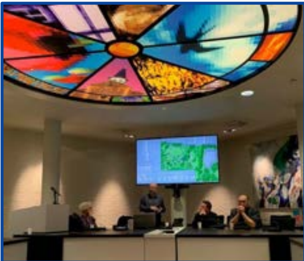
Overleg gemeente Beekdaelen

SpeL fungeert als onpartijdige schakel en voorziet beleidsmedewerkers van de nodige informatie en adviezen. Doel is om met alle gemeenten een meer bestendige relatie op te bouwen en voor 2025 willen we weer een overeenkomst sluiten met minimaal 1 nieuwe gemeente. (zie info 3. Gemeenten).