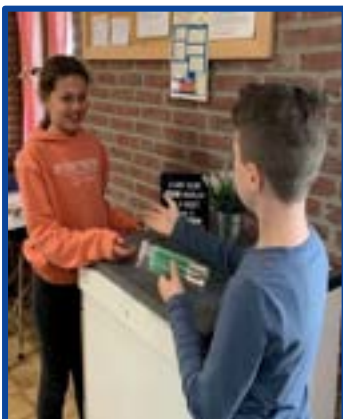
Kennis delen, Sjraavelheukske Merkelbeek

Provincie Limburg – EHBO – PPD Limburg – Veilig Thuis NML – Jeugdzorg Limburg - andere M.O.'s – cursusaanbod Speelplan/Keurmerkinstituut - contacten Euregio België