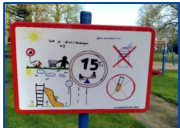
Bord speeltuin Fort Willem Maastricht