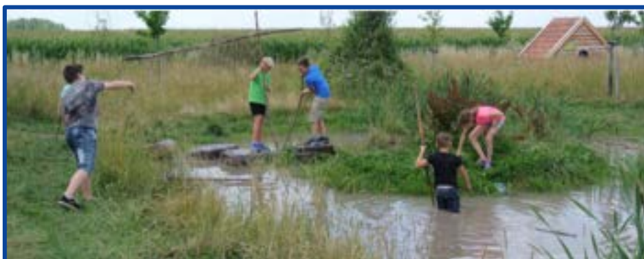
Avontuurlijk spelen in Stevensweert

Ruimte voor de Jeugd – Welzijnsorganisatiepartners die Avontuurlijk spelen warm hart toedragen- consortium ASAS-project- Mulier Instituut – 2 samenwerkende gemeenten – GGD Zuid-Limburg en GGD Noord-Limburg