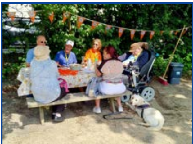
Meerdere doelgroepen 't Olifantje Heerlen