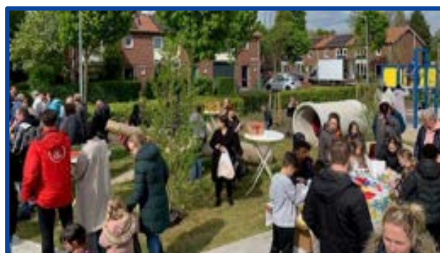
Opening Gezonde Buurt Weert

Dit samenwerkingsproject van Jantje Beton, IVN Natuureducatie en JOGG Gezonde Jeugd Gezonde Toekomst richt zich op een groene plek in een buurt waar natuur, ontmoeten, bewegen en spelen samenkomen. Het is een plek waar kinderen creatief samen spelen en waar bewoners elkaar ontmoeten.