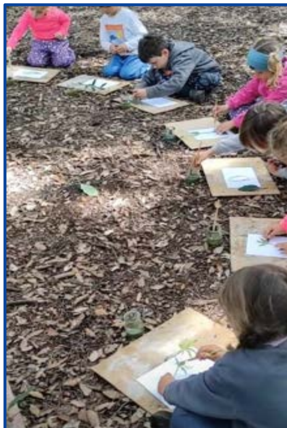
Kinderen tekenen en testen buiten