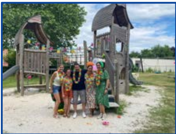
Nieuw lid 't Wipke Oirsbeek

Daarnaast vergeten we natuurlijk de traditionele vorm van speeltuinverenigingen niet. In samenspraak met gemeenten en welzijnsorganisaties bezien we of het kansrijk is om initiatieven in een wijk of buurt door te laten groeien naar volwaardige speeltuinverenigingen.