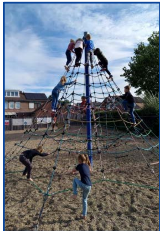
Speeltuin 't Eikhoortje Landgraaf

Onze ondersteuning in 2025 zal voor de leden bestaan uit het werken aan verbeteringen voor het behouden en versterken van de speeltuinen en de organisatie daaromheen. Het doel van onze speeltuinbezoeken is om de kennisuitwisseling te bevorderen en ondersteuning te bieden op basis van maatwerk opdat onze uren besteed kunnen worden aan projecten die ook weer ten goede komen aan het buitenspelende kind en onze leden.