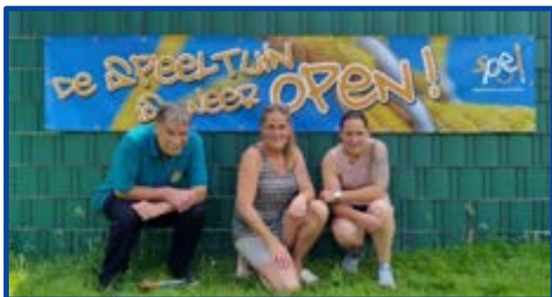
Vrijwilligers MIJN Speelpark West Kerkrade

Huis voor de Kunsten Limburg – Vereniging Kleine Kernen Limburg – Burgerkracht Limburg